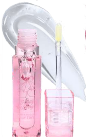
Gloss Happy Cherry L1439-01