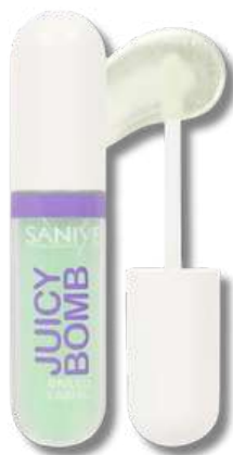
Lipgloss Juicy Bomb L1438-04