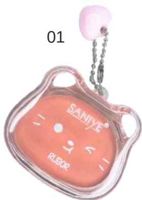
Rubor Llaverito Gatito EA013