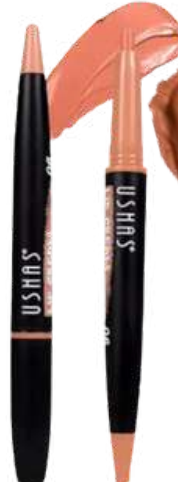
Lápiz de labios LP2330-06