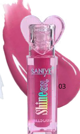
Gloss Shine On L1428